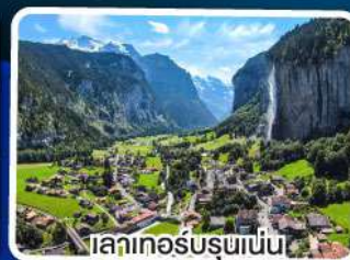
เลาเกอร์บรุนเนน