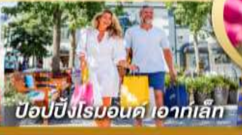
ป๊อปป์ปิงโรมอนด์ ไอคาเล็ก