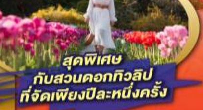
สุดพิเศษ กับสวนดอกทิวลิป ที่จัดเพียงปีละหนึ่งครั้ง