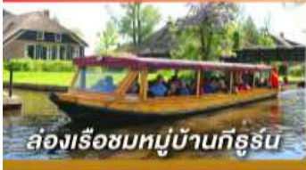
ล่องเรือชมหมู่บ้านกังหัน