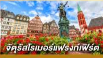
จัตุรัสโรเมอร์ฟรงก์เฟิร์ต