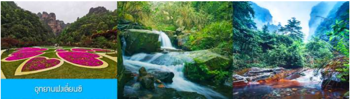
อุทยานฟงเลี่ยนซี