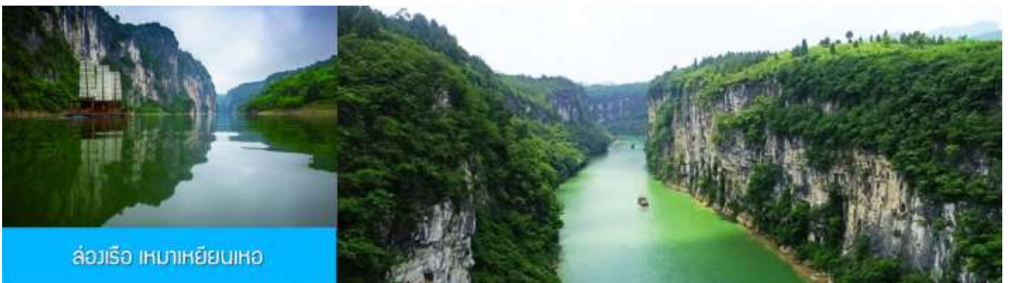
ล่องเรือ เหมาเหยียนเหอ