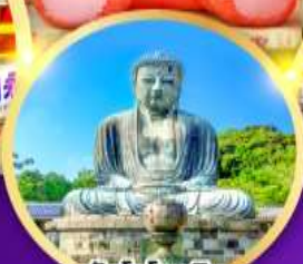
วัดโคโคคุอิน