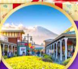
โกทเทมะ-พรีเมี่ยมเอ้าเล็ด