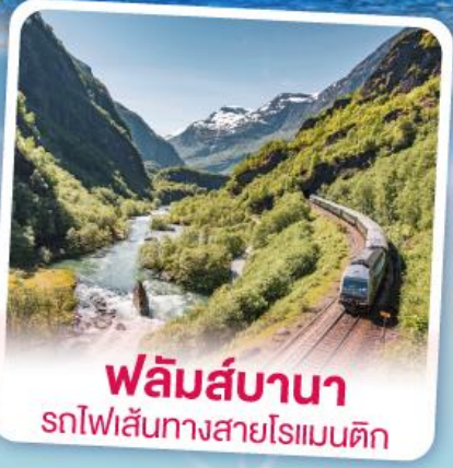
พลัมส์บานา รถไฟเส้นทางสายโรเมนติก