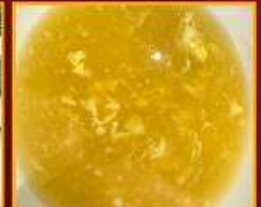
ซุปรข้าวโพด