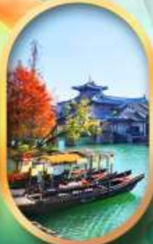
เมืองโบราณผู้หยวน