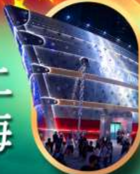
เรือคอะหลุยส์