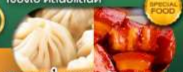
พิเศษ เสี่ยวหลงเป่า หมูตงพอ เดินทาง ม.ค. - มิ.ย. 69