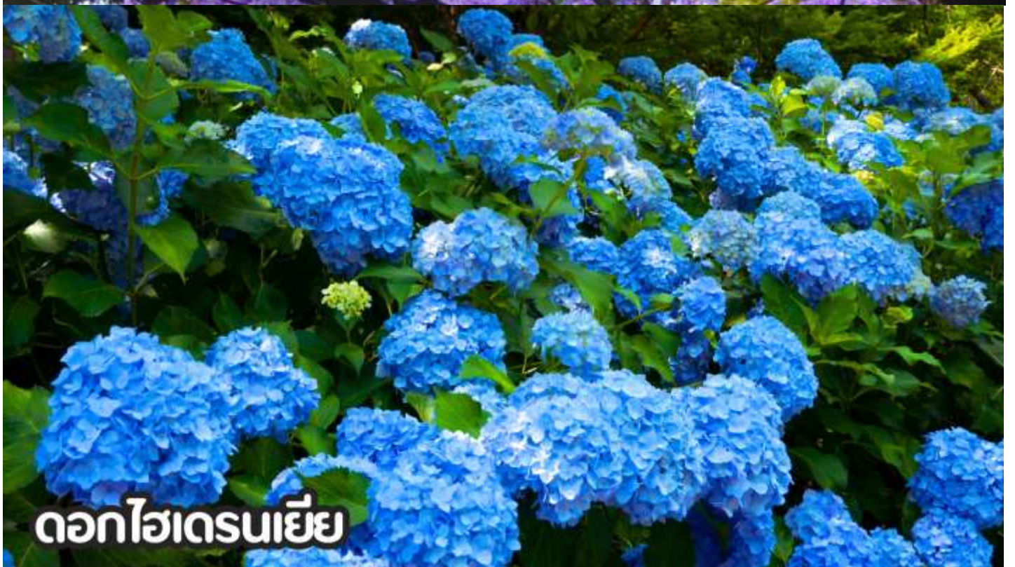
ดอกไฮเดรนเยีย

**หมายเหตุ: โปรแกรมชมดอกไม้ช่วงเดือน พ.ค. - ต.ค.2569 ในช่วง ณ วันเดินทางดังกล่าว หากดอกไม้ยังไม่บานหรืออาจจะร่วงหล่น..ทั้งนี้ขึ้นอยู่กับสภาพอากาศของแต่ละปี ทางบริษัทไม่การันตีและไม่สามารถกำหนดการบานของดอกไม้ได้ ทางบริษัทฯ ขอสงวนสิทธิ์ปรับเปลี่ยนรายการท่องเที่ยวอื่นทดแทนนะคะ รบกวนท่านโปรดทราบและทำความเข้าใจค่ะ**