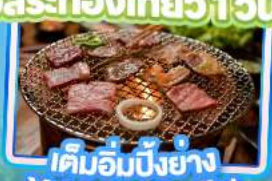
เค็มอิมบิงย่าง Yakiniku Buffet