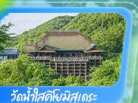
วัดน้ำใสคิโยมิสุเดระ