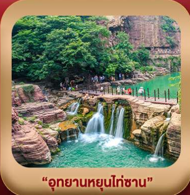
“อุทยานหยุนไท่ซาน”

ชมถ้ำหลงเหมิน มรดกโลกที่เมืองลั่วหยาง • สุสานจีนซีฮ่องเต้ • ศาลเจ้ากวนอู วัดเส้าหลิน + ป่าเจดีย์ + ชมโชว์กังฟู • เมืองโบราณลั่วอี้ • อุทยานหยุนไท่ซาน เจดีย์ห่านป่าใหญ่ • ถนนวัฒนธรรมต้ากิง • ถนนคนเดินอิสลาม • จัตุรัสหอระฆัง