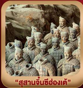
“สุสานจีนซีฮ่องเต้”