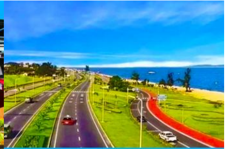
ถนนหวนเต่าลู่