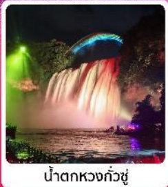
น้ำตกหวงกั๋วซู่