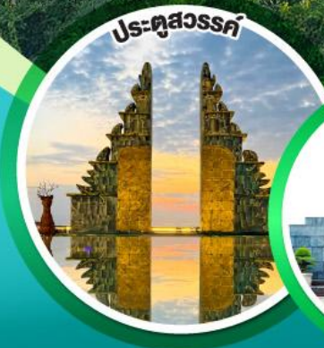
ประตูลสุวรรณค์