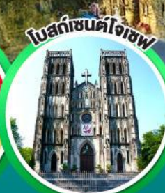
โบสถ์เซนต์โจเซฟ