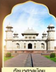
ถ้ำมาฮาลันย