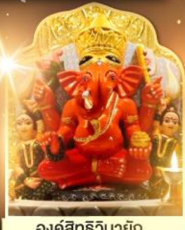
องค์สิทธีวินายก