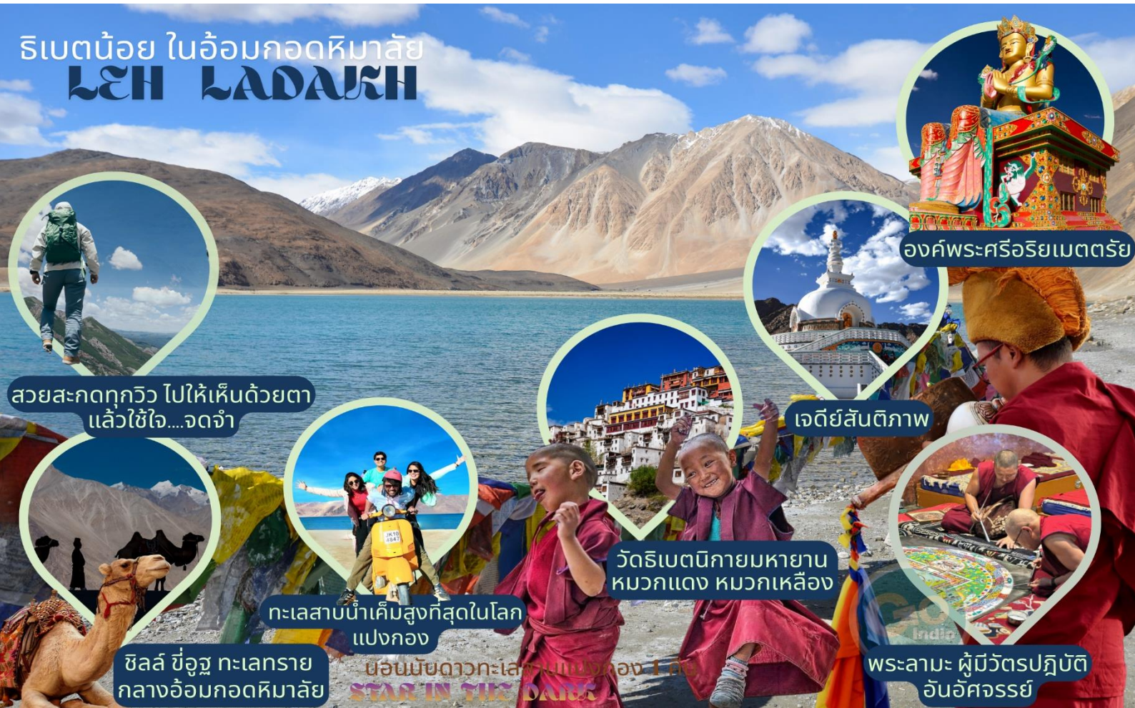
องค์พระศรีอริยเมตตรีย์