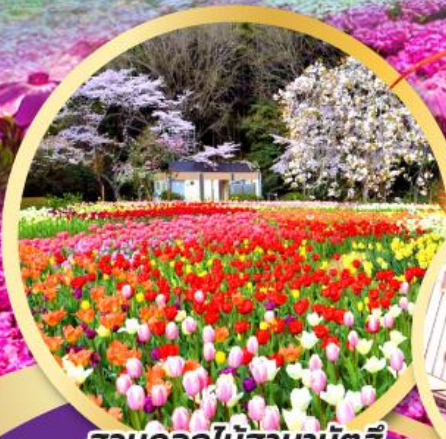
สวนดอกไม้ฮามามัตสึ