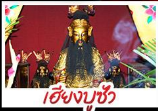
เซียงบูชัว