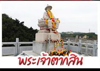
พระเจ้าตากสิน