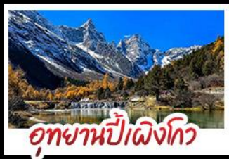
อุทยานปี่เผิงโกว

อุทยานสี่รถณี - อุทยานปี่เผิงโกว - อุทยานจิวจ้ายโกว รถไฟความเร็วสูง - EASTERN SUBURB MEMORY ถนนโบราณความจำ - วัดต้าฉือ ช้อปปิ้งย่านคัง ถนนไท่กู่หลี่ + ถนนซุนซีลู่