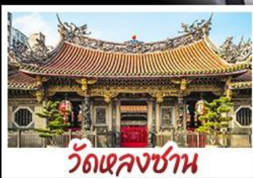
วัดเจหลงซาน