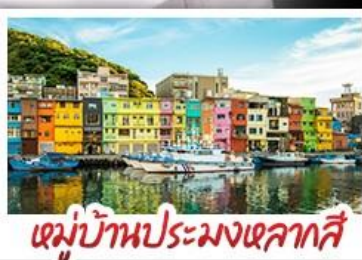
หมู่บ้านประมงเหลากาสี