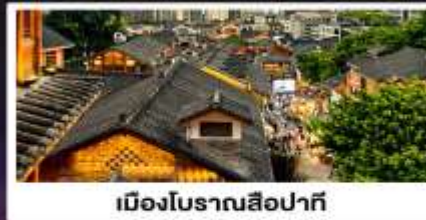
เมืองโบราณสือปาตี