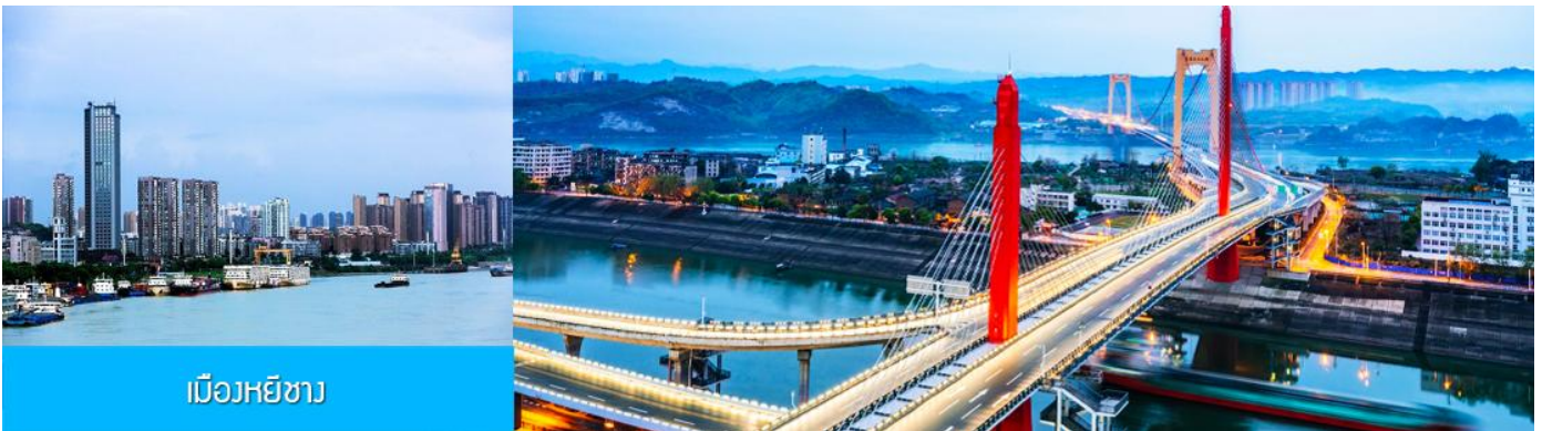
เมืองหยีซัง