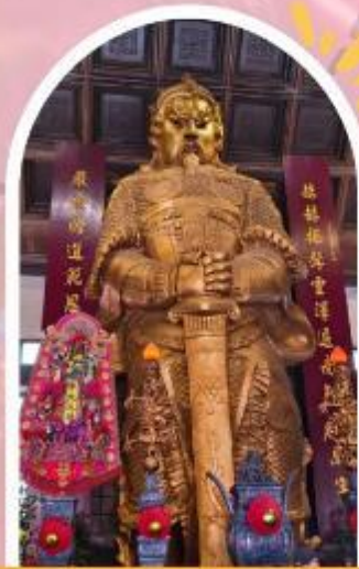
วัดแซกง ขอพรโชคลาก การเงิน และธุรกิจ