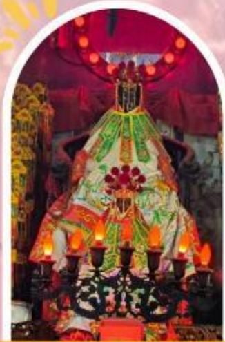
วัดเจ้าแม่กวนอิมฮ่องกง ขอพรเรื่องเงิน ทรัพย์สิน และความมั่งคั่ง