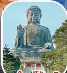
พระใหญ่โป้วหลิน