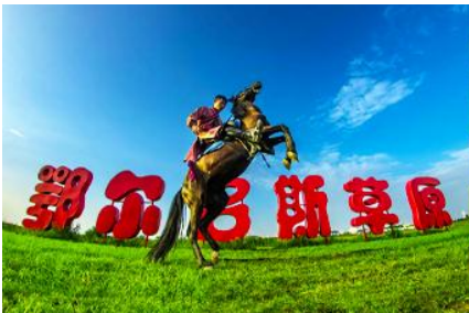
ทุ่งหญ้า เออร์ดอส

พักที่ ORDOS BOYU AIRUI HOTEL โรงแรมระดับ 4 ดาวท้องถิ่น หรือเทียบเท่าในเมืองเออร์ดอส