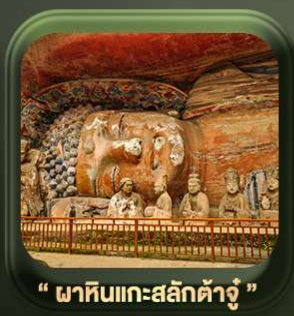
“ พาทินแกะสลักต้าจู้ ”