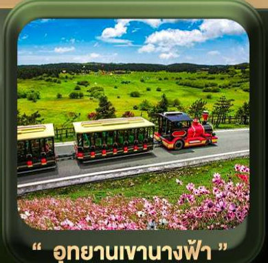
“ อุทยานเขานางฟ้า ”

T2G-CKG26CZ Special of Chongqing... วงซิ่ง ต้าจู้ อุ้หลง อุทยานหลุมฟ้า เขานางฟ้า 5D 3N (CZ)