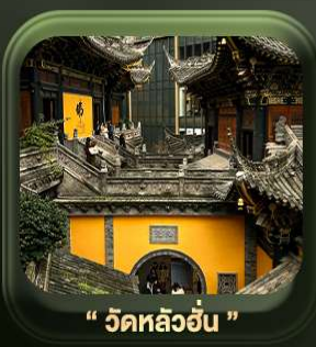
“ วัดหลิวฮั่น ”