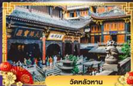
วัดหลัวหวน