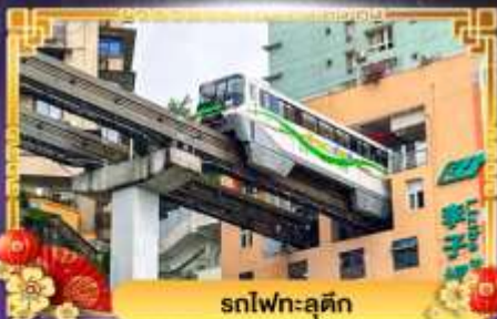
รถไฟฟ้า-ลูตัก