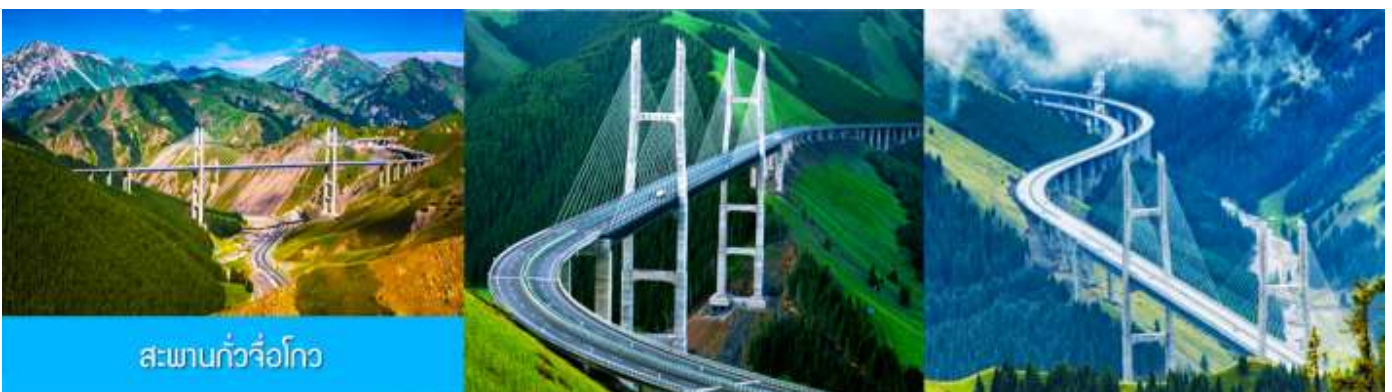
สะพานกั๋วจื่อโกว

หลังอาหารนำท่านเดินทางโดยรถบัสสู่ ตำบลนำลาตี 那拉提 (ระยะทาง 300 กม. ใช้เวลาเดินทางราว 4 ชั่วโมง)