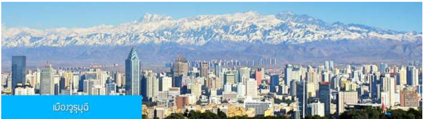
เมืองวุรูมู่ฉี