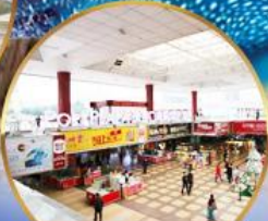
ตลาดกึ่งเป๋ย