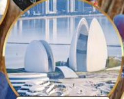
โรงละครหอยโข่มุก