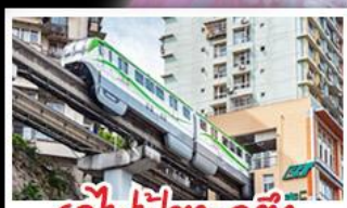
รถไฟฟ้าทะเลลึก