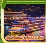
ส่องเรือแม่น้ำเจียงหนิง