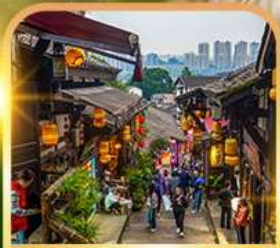
หมู่บ้านโบราณฉือซีโซ่ว