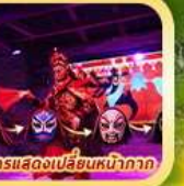
การแสดงเปลี่ยนหน้ากาก