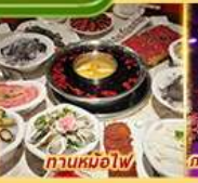
กานหม้อไฟ