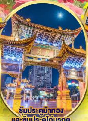
ซุ้มประตูม้าทอง และ ซุ้มประตูไถ่เมรกถ