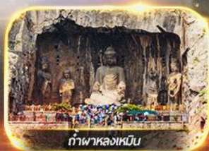
กำแพงหล่งเหมิน