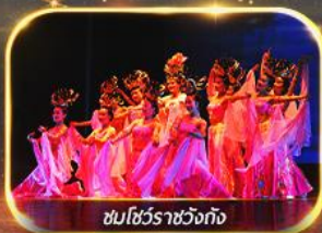
ชมโชว์ราชวงศ์ถัง

นั่งรถไฟความเร็วสูง ย้อนประวัติศาสตร์อันยิ่งใหญ่ "กองทัพทหารจีนซี" สัมผัสความงามอุทยานสวรรค์ พิเศษ!! ชมโชว์ราชวงศ์ถัง เก็บครบทุกไฮไลต์ ซอปปิงจู่ใจ ห้าง WU YUE