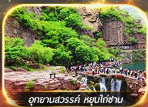
อุทยานสวรรค์ หยุนโก่ซาน