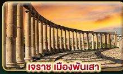
เอราซ เมืองพันเสา