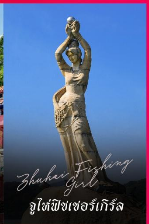
Zhuhai Fishing Girl จูไห่ฟิชเชอร์เก็ทส์