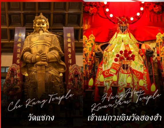
Che Kung Temple วัดแซกง

รายการทัวร์ข้างต้นอาจมีการปรับเปลี่ยนเพื่อความเหมาะสม