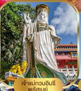
เจ้าแม่กวนอิม พลัสเบย์