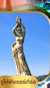
จูไห่ฟิชชอร์ทิวรา