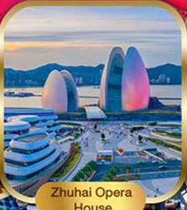
Zuhai Opera House