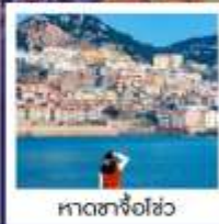
หาดซาโจฮั่ว