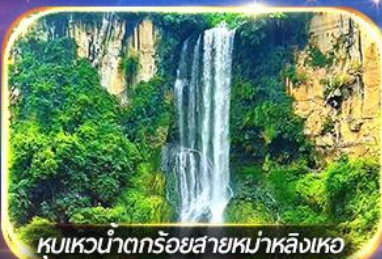
หุบเขาน้ำตกร้อยสายหน้าหลิงเหอ