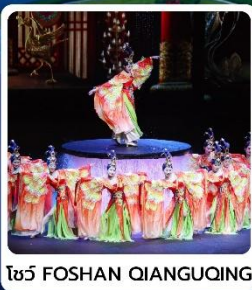
โชว์ FOSHAN QIANGUING