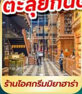
ร้านไอศกรีมมียาฮาร์