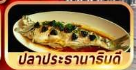
ปลาประรานาภิรมดี