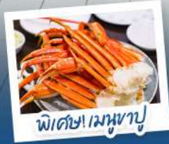
พิเศษ! เมฆหุขุ