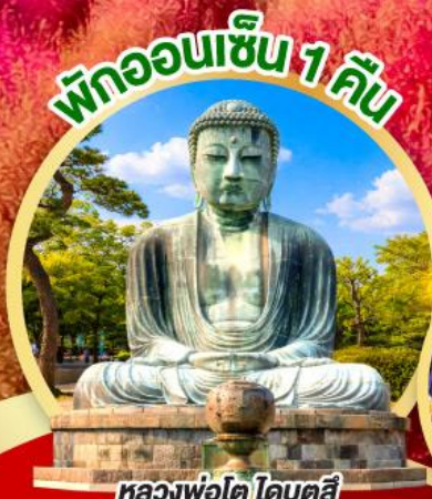
หลวงพ่อโต ไคบุตสึ