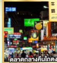
ตลาดกลางคืนโกตง