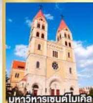
มหาวิหารเซนต์ไมเคิล