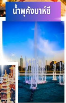
น้ำพุคังบาหิซี