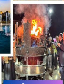
ปาร์ตี้รอบกองไฟ