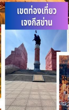
เขตท่องเที่ยว เจงกิสข่าน