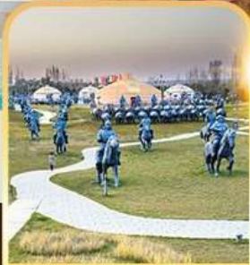
สวนเจงกิสข่าน