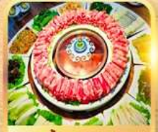
สุกีสไตล์มองโก