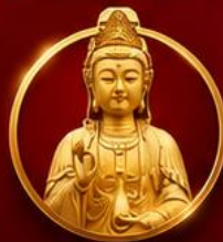
รับพลังบารมีเจ้าแม่มาจู่