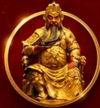
ขอพรเทพเจ้ากวนอู

เปิดดวงเศรษฐี เสริมดวงจួយี่ใต้หวัน ขอพรเทพกวนอู รับพลังบารมีเจ้าแม่มาจู่ 4 วัน 3 คืน