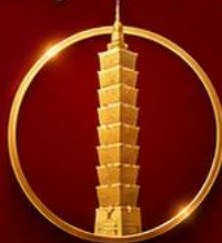
เสริมดวงเศรษฐี