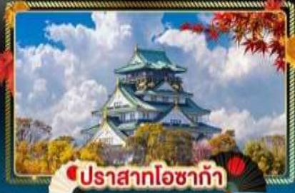
🍁 ปราสาทโอซาก้า