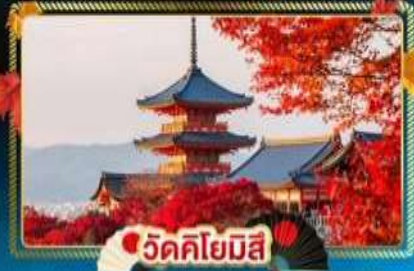
🍁 วัดคิโยมิสึ