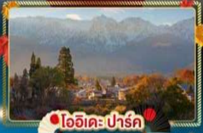
🍁 โออิชิ ปาร์ค