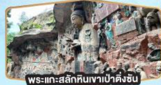
พระแกะสลักหินงาป่าตั้งชัน