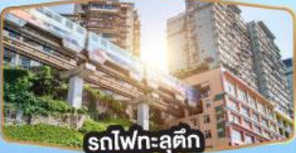
รถไฟฟ้า-สุตึก