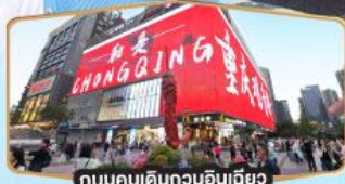
ถนนคนเดินถวณอันเฉียว