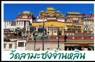
วัดลามะซงจ้านหลิน

กุหาหิมะมังกรหยก - วัดลามะซงจ้านหลิน รถไฟชมวิวกุหาหิมะมังกรหยก ร้านกาแฟ MOYE CLIFF COFFEE ช่องแคบเสื่อกระโจน หุบเขาพระจันทร์สีน้ำเงิน เมนูพิเศษ สุกีปลาเซลมอน สุกีหืด อาหารกวางตุ้ง