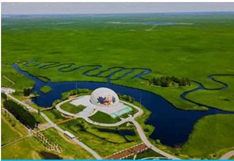
อุทยานชุ่มชื้นจาหลง

รับประทานอาหารเช้า ณ ห้องอาหารของโรงแรม (7)