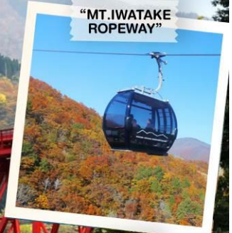
"MT. IWATAKE ROPEWAY"