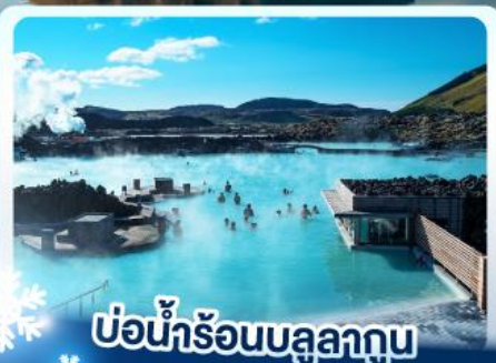
♨️ แช่น้ำร้อนบลูลากูน

เก็บไอซ์แลนด์ แดนภูเขาไฟคิรูกูเฟล และ แช่น้ำร้อนบลูลากูน