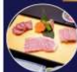
บุฟเฟ่ต์ ซาบุสไตลญี่ปุ่น